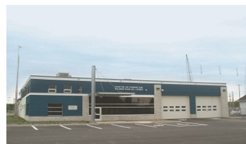
Centre de formation en montage de lignes de Saint-Henri

Le centre de formation en montage de lignes de Saint-Henri, situé à moins de 20 km de la ville de Lévis, est le seul centre au Québec, autorisé par le MELS, à offrir le programme Montage de lignes électriques. La demande de monteurs de lignes est présentement à son point culminant. Le centre n'a pas ménagé ses efforts pour assurer une réponse adéquate à cette demande. Le résultat s'est traduit par une augmentation substantielle du nombre de diplômés. Les sites de formation ont également augmenté pour être au nombre de cinq. Deux dans la région de Saint-Henri/Lévis et trois dans la région de Montréal. L'intérêt pour ce programme ne se dément pas. Nous avons reçu plus de 3 000 demandes d'admission en 2010-2011.